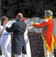
Museumsnacht im Torhaus Döllitz