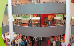
Ausstellungseröffnung im Deutschen Fotomuseum