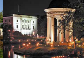
Fest der 25.000 Lichter