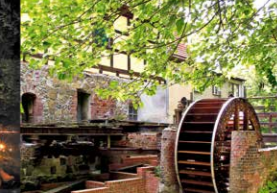
Wasserrad in der Dölitzer Wassermühle