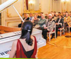
Konzert im Spiegelssaal des Weißen Hauses