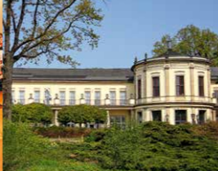
Speisen und Feiern im Parkschlösschen