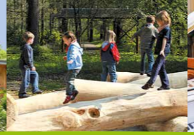
Toben auf dem Spielplatz KinderReich